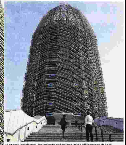
La "Torre Zucchetti", inaugurata nel giugno 2017, all'ingresso di Lodi

L'ingresso della torre uffici del gruppo Zucchetti, simbolo di una realtà economica in continua espansione