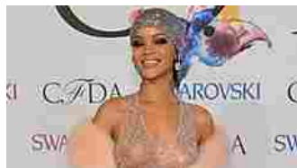
Questi look delle vip hanno indignato il pubblico! ALFEMMINILE.COM