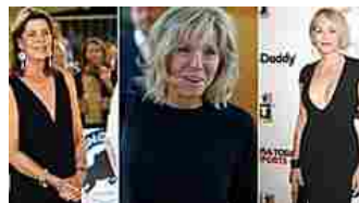
Brigitte Macron e la carica delle sessantenni (belle e chic) Io DONNA