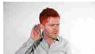
Svelati innovativi apparecchi acustici invisibili PREVENTIVI.CLINICOMPARE.COM