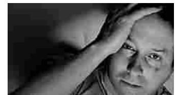
Sai che chi soffre di spondilite anchilosante spesso ha difficoltà a dormire? SAICHELASA.IT