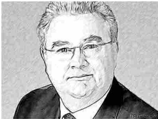
Milano Lombardia Legal Chronicle >

Warrant Hub (Tinexta) acquisisce due società di consulenza in Francia e Bulgaria