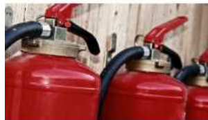
PREVENZIONE INCENDI: corso

EASIER: vi presentiamo servizi e sito web. Venite a darci il... 1 Maggio 2024