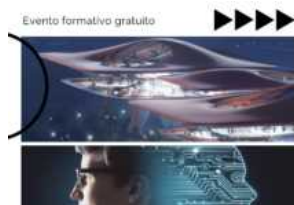
Creatività artificiali. Essere