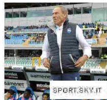
Pescara, Zeman: "Non riusciamo a fare gol"