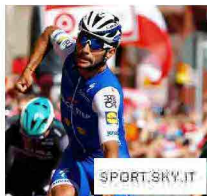
Giro d'Italia 2017, Gaviria vince la terza tappa