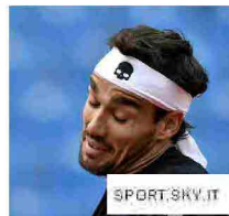
Madrid, Fognini batte Sousa e trova Nadal