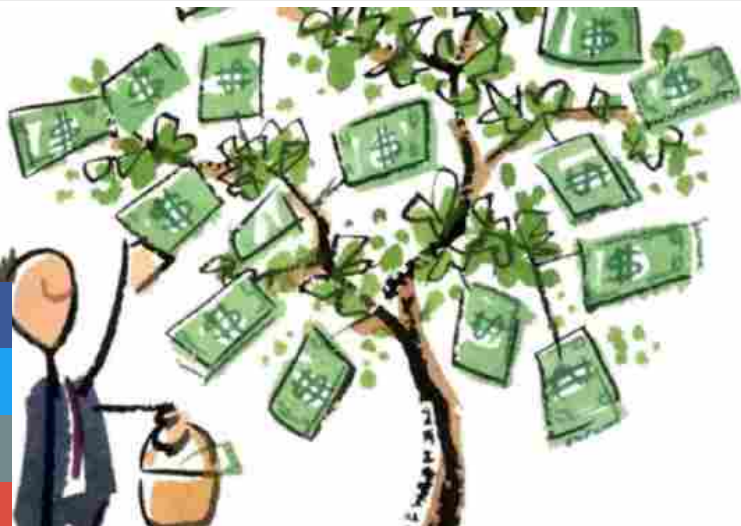
Finanziamenti a imprese e startup, divisi per regioni

Condividi Una persona consiglia questo elemento. Iscriviti per vedere cosa consigliano i tuoi amici.